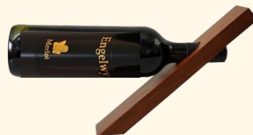
Flaschenstander aus lokalem Holz

Schon mehrfach haben wir im Rahmen von Neupflanzungen die Moglichkeit offeriert, Pate oder Patin von Rebstocken zu werden. Fragen Sie uns, wenn Sie interessiert sind.